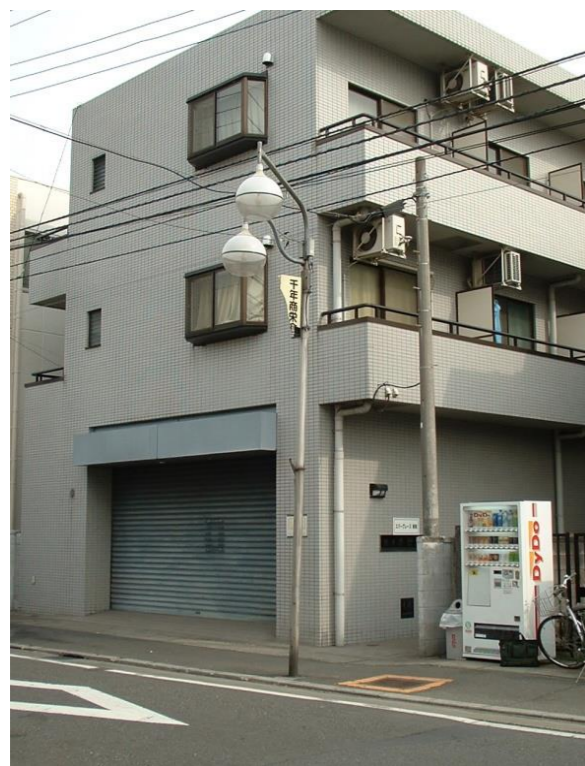
図面と現況が異なる場合、現況を優先します。